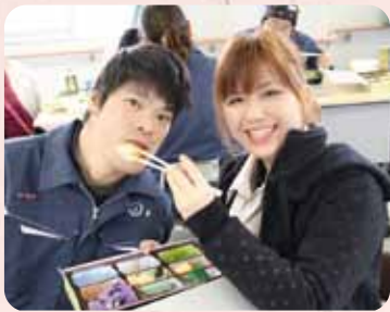
▲うどんの次はお花見弁当!