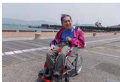
▲潮風が気持ち良い！