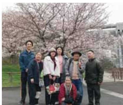
▲門入ダムの前でハイ・ポーズ！