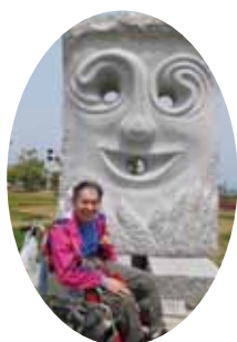
▲サンポート広場にて

5月3日(土)、移動支援でサンポートに行ってきました。大好きな電車にのり、楽しみにしていたお寿司を食べ、ショッピングをして、一日楽しんできました。移動支援とは、障がい者が社会生活上必要不可欠な外出及び余暇活動等の社会参加のための外出の際にガイドヘルパーが移動の支援を行うことです。利用者様が心豊かな暮らしを実現できるよう、安全で安心な、よりよいサービスを提供していきたいと日々頑張っています。