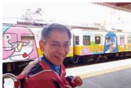
▲ことちゃん電車をバックに

5月3日(土)、移動支援でサンポートに行ってきました。大好きな電車にのり、楽しみにしていたお寿司を食べ、ショッピングをして、一日楽しんできました。移動支援とは、障がい者が社会生活上必要不可欠な外出及び余暇活動等の社会参加のための外出の際にガイドヘルパーが移動の支援を行うことです。利用者様が心豊かな暮らしを実現できるよう、安全で安心な、よりよいサービスを提供していきたいと日々頑張っています。