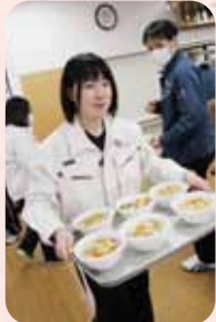
▲花よりうどん! なのです