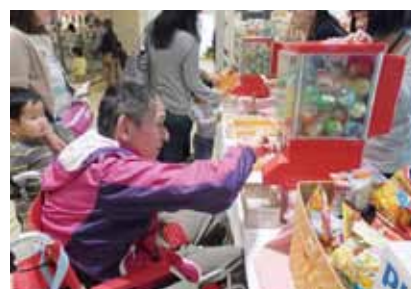
▲初ガチャ 何が出るかな？