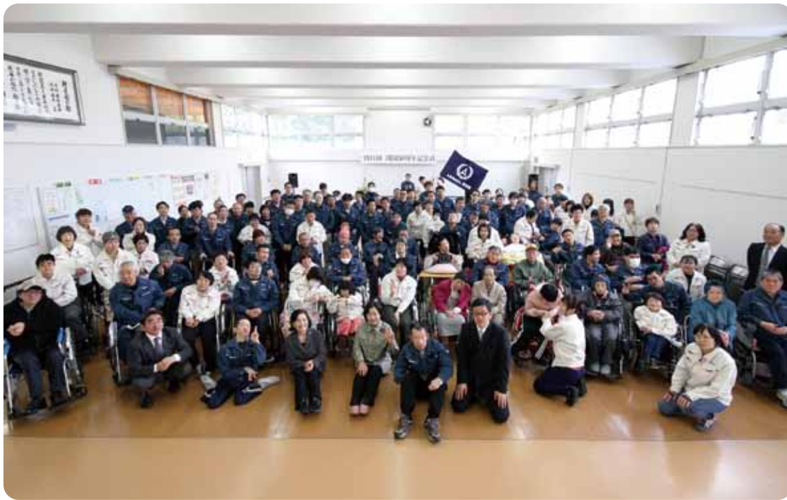
▲集合写真（平成26年4月5日 朝日園開園38周年記念式にて）