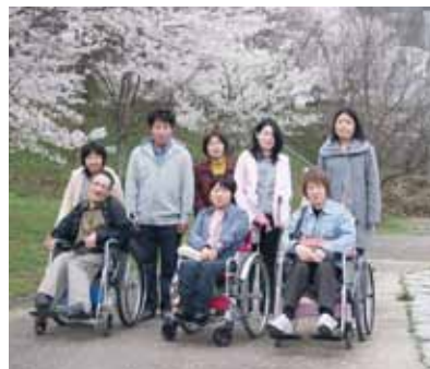
▲満開で満足でした！