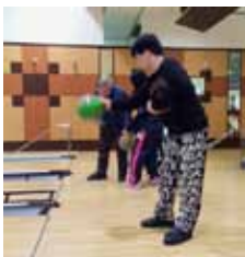
▲大きくふりかぶってー

3月7日(金)の外出行事は、利用者の皆さんから「ボウリングがしてみたい!」という要望があり、ボウリング大会を開催しました。ストライクやスパアを出すとガッツポーズをして喜ばれるなどとても楽しまれていました。次回も開催したいと思います。