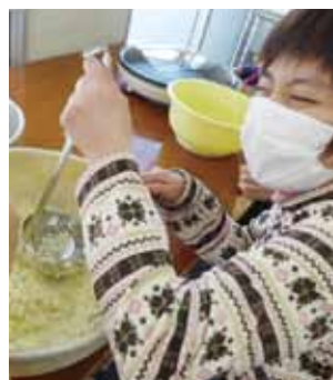
▲ポテトつぶしは得意☆

それぞれの利用者様に役割分担をして頑張って作りました。「自分で作ったものは何倍も美味しい。」と口いっぱい笑顔で頬張っていました。