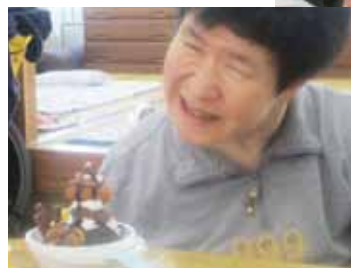
▲自分で作ったお菓子は格別！

障害者ホームヘルプあさひでは、利用者の皆さんの気持ちを大切に、笑顔ある暮らしのお手伝いができるよう支援していきます。