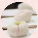
▲抹茶も振る舞われました