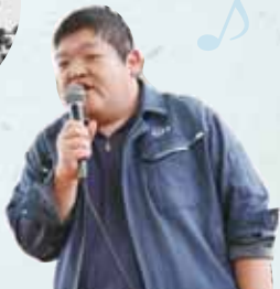
▲歌うことが大好きな皆さん