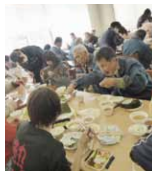
▲おいしくて止まらない!