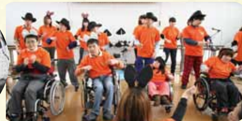
▲平成バンド 今年は飛び入り参加もありました