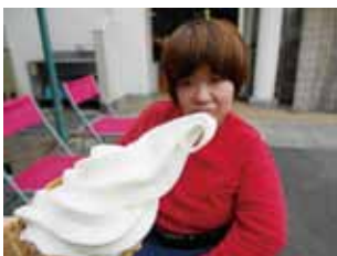
▲名物ソフトおいしそう!

4月2日(水)、今年のお花見は「道の駅ながお」に桜を見に行きました。皆さん満開の桜を見た後は、ソフトクリームを食べたりして楽しく過ごされていました。