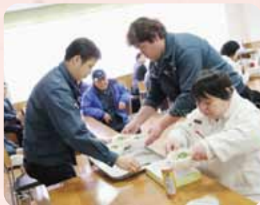
▲まずは軽うどんから…